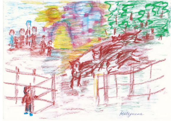
Рис. 1. «Небезпека»

А.: «Небезпека» – найцікавіший, дивний (див. рис. 1).