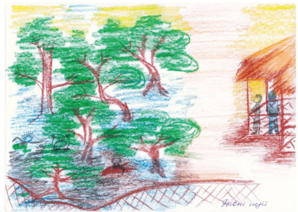
Рис. 3. «Дивні події»

П.: Наступний малюнок «Дивні події» (див. рис. 3).