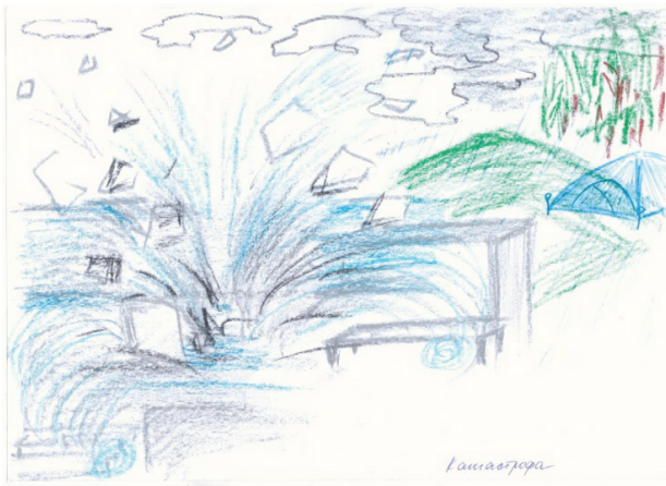
Рис. 4. «Катастрофа»

А.: К-т 10 . Це болотиста долина, в якій ми вирішили поставити намет. Десь там є ліс.