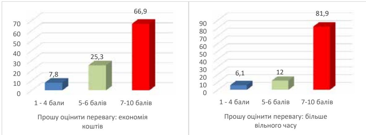
Рис. 5. Оцінка переваг економії коштів та часу