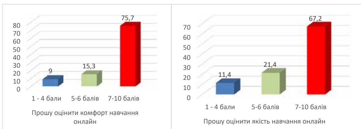
Рис. 2. Оцінка якості та комфорту віртуального навчання