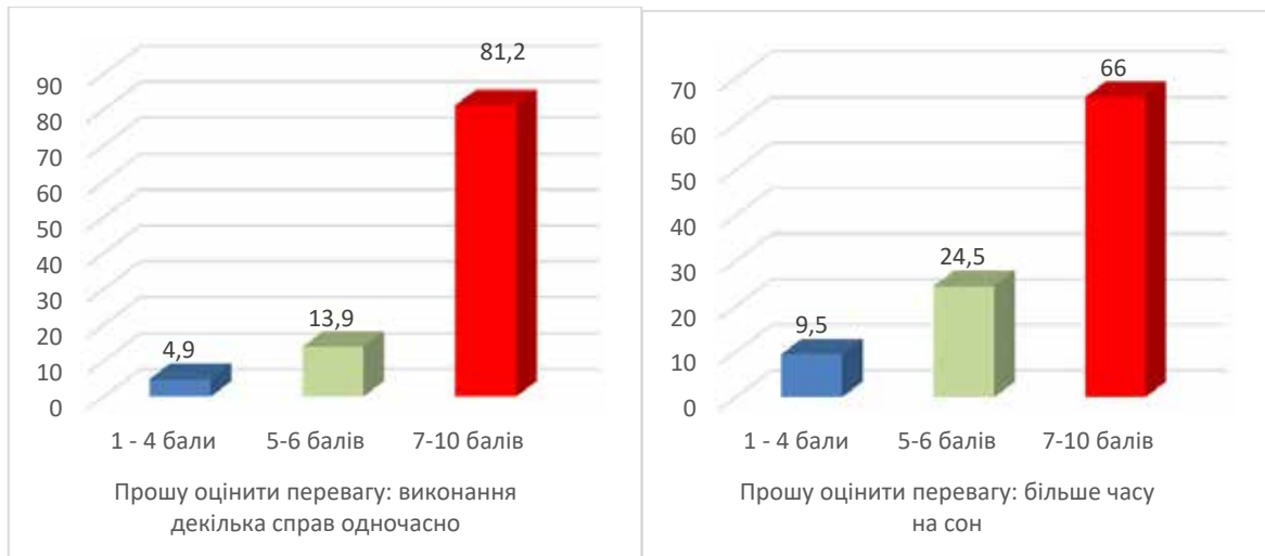
Рис. 6. Оцінка переваг поєднання навчання з іншими справами та краща якість сну