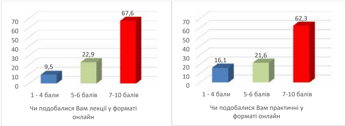
Рис. 3. Оцінка лекцій і практичних на онлайн-навчанні

Ставлення до семінарських занять у форматі онлайн було аналогічним до оцінки лекцій і практичних: 65,7% опитаних засвідчили, що їм подобається така віртуальна форма навчання, 20,4% поставили нейтральну оцінку та 13,9% не подобаються такі заняття у форматі онлайн.