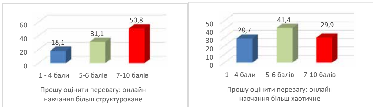
Рис. 7. Оцінка переваг структурованості та хаотичності онлайн-навчання

оцінка, негативна (для 28,7%) та позитивна (для 29,9%), відсутність порядку оцінили третина осіб (див. Рис. 7).