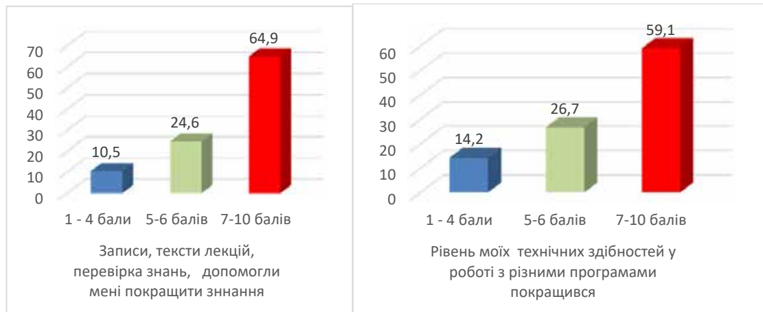
Рис. 8. Оцінка якісних характеристик онлайн-навчання

(для 64,9%). Також досліджувані здобувачі знань (59,1%) констатували покращення рівня технічних здібностей і навичок.