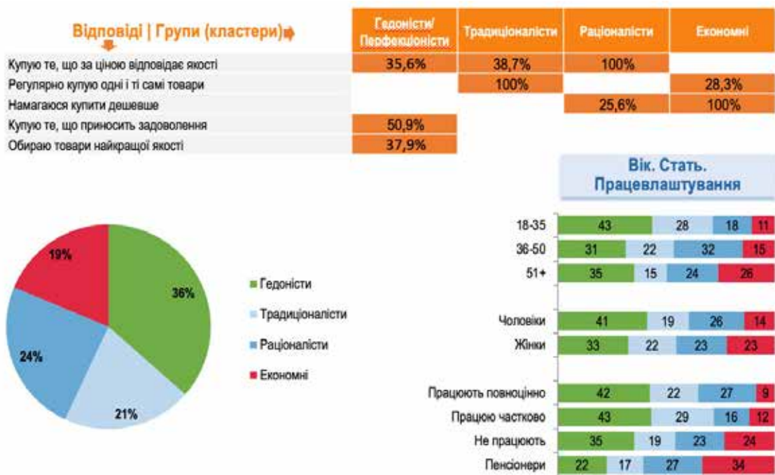
Рис. 3. Стратегії споживчої поведінки (жовтень 2022 р.)

Згідно з результатами емпіричних досліджень за період 2021–2022 рр., українці загалом і під час війни мають проактивну життєву позицію, готові активно шукати роботу, хочуть жити не гірше за інших, однак менш упевнені у своїй можливості впливати на доходи під час війни. Зазнали скорочення зарплат, але ставляться до цього з розумінням. Готові навчатися новому, змінювати професію та займатися підприємництвом. Серед стратегій споживчої поведінки